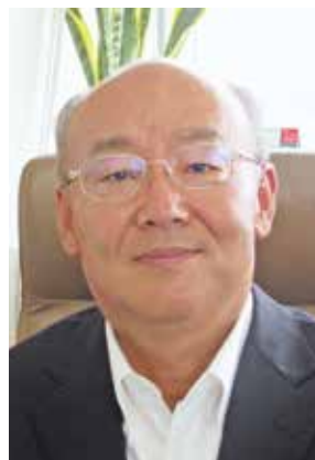
公益社団法人 千葉県情報サービス産業協会 会長

引き続き会員の皆様とともに業界並びに地域の発展に向けて諸活動を展開し皆様のお役に立ちたいと考えておりますので、ご支援・ご協力をお願いいたします。