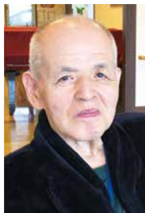
公益社団法人 千葉県情報サービス産業協会 副会長

CHISAの会員企業には何をしたいのか、目標を持って狭く深く追及し元気の良い千葉にして欲しいと願います。