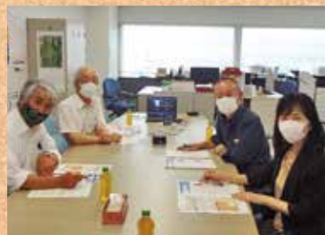
広報部会開催風景