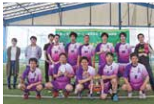
プロトーナメント優勝 (シーティン(NID・MI))