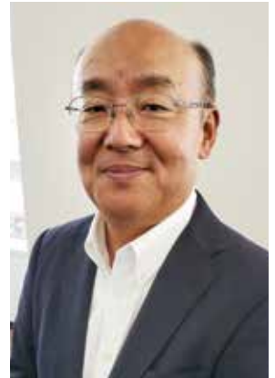
公益社団法人 千葉県情報サービス産業協会 会長

そして、各産業界では、AIの活用、IoTの普及拡大など環境変化が激しい中ではありますが、我々IT業界が全産業を牽引していく使命があることは間違いありません。そして、その責任を全うすべく、協会としましては従来の部会活動に加え、公益社団法人としての活動範囲を拡大し、会員の皆様とともに県内自治体、他業態を含めた関係諸団体などとの連携を一層密にして、業界並びに地域の発展に向けて諸活動を展開し、皆様のお役にたちたいと考えておりますので、引き続きご支援・ご協力をお願い致します。