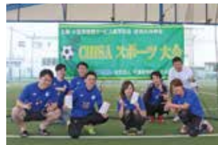
マイナートーナメント優勝 (信頼とサービス(伏崎コンピュータエンテアリング))