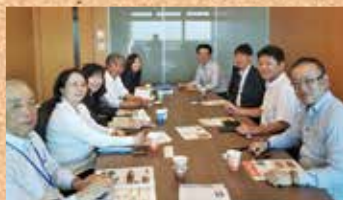
広報部会開催中です