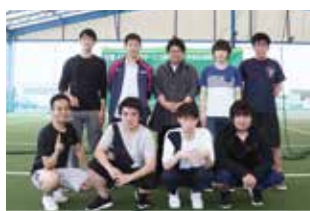
リトルトーナメント優勝 (船橋情報ビジネス専門学校A)